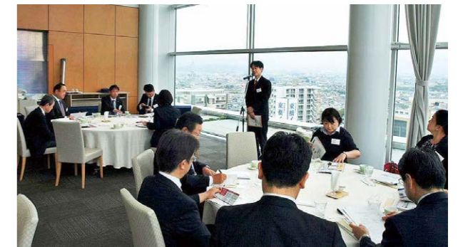
▲自社紹介タイムの様子

当所入会2年以内の会員事業所様を対象に、新入会員同士の交流を深めていただくとともに、当所の各種サービス事業を紹介し、当所を活用していただくため開催しています。