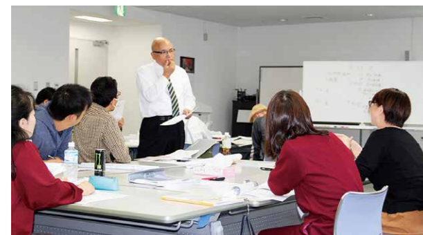
▲講師との質疑応答