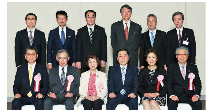
▲平成 29 年度を受賞事業所