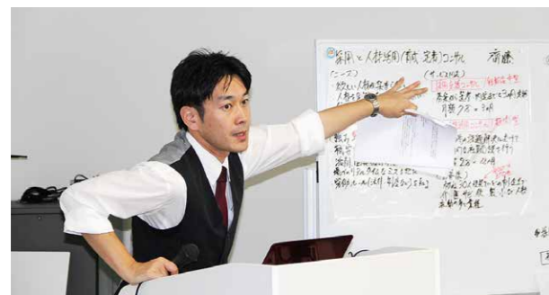
▲ビジネスプランをプレゼン中!