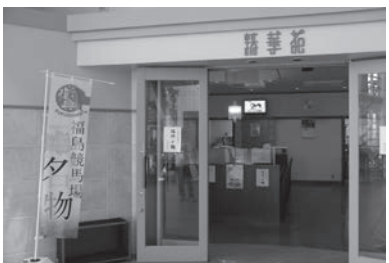
競馬場4階は落ち着いた雰囲気

は著しく向上したと実感しています。女性だけのグループも多く来店します。ひと昔前には考えられない光景で