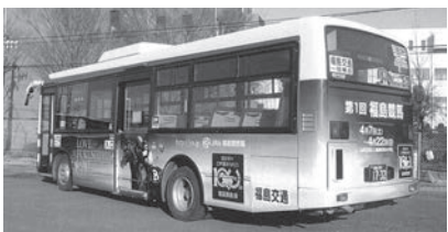
100周年ラッピングバス

福島競馬場が管理する7つの駐車場の収容台数は合計1,629台と限りがあります。福島競馬場では、できるだけバスなど公共交通機関での来場を呼びかけています。