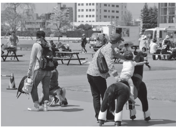
馬場内広場は子ども向けの遊戯施設も充実。キャラクーションの開催日は大勢の家族連れで賑わいます。

平成23年の東日本大震災の際には、備蓄されていた食料や飲料水が避難者に提供されました。しかしながら、競馬場自体の損傷に加え、原発事故の影響はあまりに大きく、福島競馬が再開されたのは、震災から1年後の平成24年春でした。