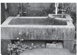
写真は馬頭観音。

仲間町の馬頭観音と信夫橋のたもとには、帝国競馬協会が昭和6年に設置した「牛馬給水場」が残っています。上杉氏が馬の鍛錬場として使用した歴史を持つ馬頭観音堂は、国道4号の拡幅工事に伴い現在地へ移転しました。福島市と馬との強いつながりが史跡からも読み取れます。