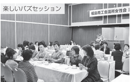
楽しいバスセッション