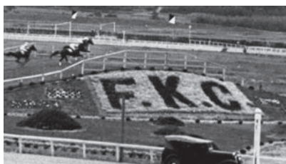
コース一角にあるFKCの植栽。福島競馬倶楽部(FKC)がなければ、いまの福島競馬場はありません。馬場を造り直した時この植栽は残されました。