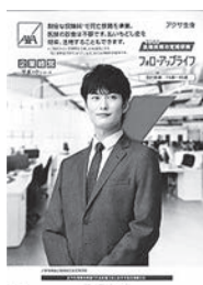
役員退職慰労金の準備にご活用いただけます。

・死亡退職金や弔慰金、解約時の払い戻し金を利用した役員退職慰労金の準備にご活用いただけます。