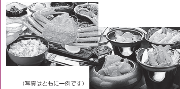
(写真はともに一例です)

今後も四季折々の相馬の美味しい食材を揃え「食彩祭」を展開しながら活動して参りますので、是非、相馬市へお越しください。