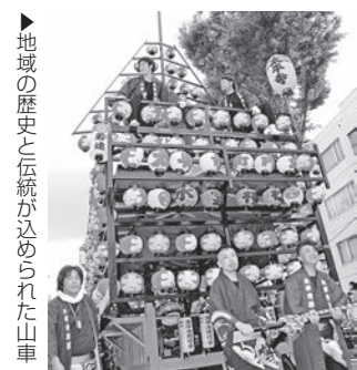
地域の歴史と伝統が込められた山車