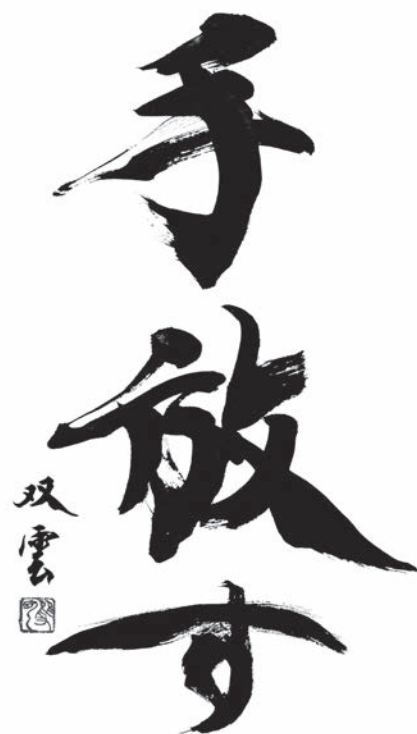
武田 双雲 たけだ・そううん