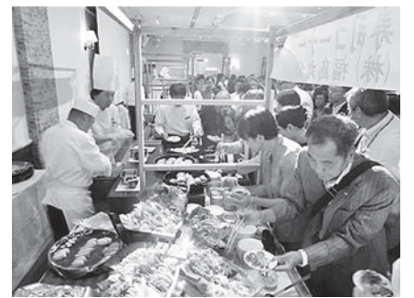
写真：昨年の創立100周年記念ビアパーティー 美味しいもの盛りだくさんの賑やかな屋台