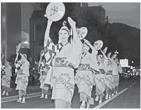
▲艶やかな山形花笠舞踊団

また、今回は東北中央自動車道開通を記念し、特別出演として隣県の山形県から「山形花笠まつり」山形花笠舞踊団による正調女踊り・正調男踊り、相馬市からはみなと保育園に