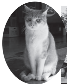
看板猫のごまきち君 他3匹の人なつっこいニャンコたちが優しく出迎えてくれます

桜本字湯湯11 ☎591・3173 営業期間 4月下旬〜11月中旬 日帰り入浴可(税込500円)