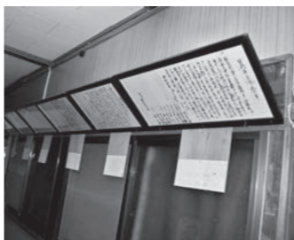
開湯以来のお湯の権利が記されています

正直、福島はあまり「パツとした」まぢではないけれど、非常に治安が良いことは素晴らしいと思っています。これを維持した上で、活発な商業活動で景気が良くなっていくことを期待しています。