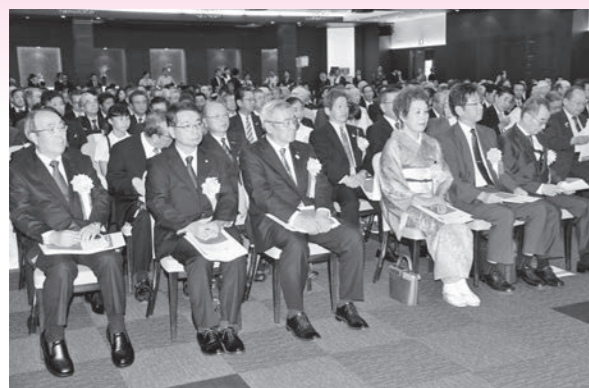
ご参りいただいた各部門の受章者の皆さま (全受章者名簿はP4~5に掲載)

去る9月13日(水)、ウエディングホテルにおいて開催した当所創立100周年記念式典には、ご来賓を始め約400名の方々にご参列を賜りました。歴代正副会頭ら当所役員や事業協力者などへの感謝状の贈呈、創業100周年事業所への表彰状の贈呈とともに、小学生作文コンクールの最優秀作品の朗読や応募作文をタイムカプセルに封入するセレモニーなどを盛大に執り行い、関係各位の功績を称えるとともにこれからの100年への更なる飛躍を誓いました。