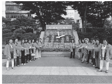
100周年をデザインした花時計

9月13日に開催されました、福島商工会議所創立100周年記念式典に合わせ、デザインも100の数字が設計され、花時計前を行き来する方々にもPRができたと思います。