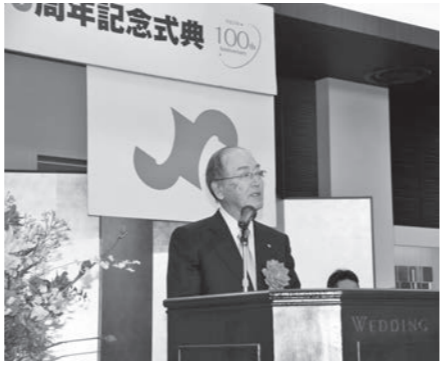
「福島の復興再生に向け尽力を期待する」とのご祝辞をいただいた日商三村会頭