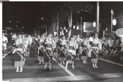
恒例のわらじおどり