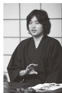
武田 双雲 たけだ・そうん

書道家。熊本育ち。3歳から母である双葉(そうよう)に師事。東京理科大学、NTT退社後、ストリートからはじめる。NHK大河ドラマ「天地人」や世界遺産「平泉」など数々の題字を手がける。全国でユニークな個展を開催。著書は、作品集【絆】、【上機嫌のすすめ】など20を超える。書道教室は約300名(2005年より満席状態が続く)。公式ブログ「書の力」のアクセス数は、1日5万を超える。 ⇒ http://ameblo.jp/souun