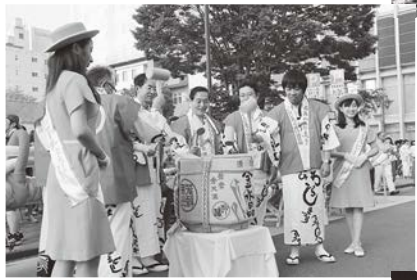
修祓式での鏡割り