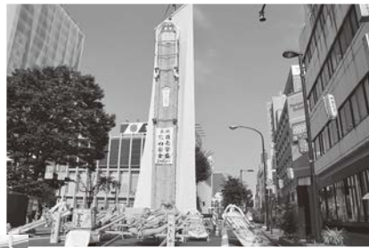
多くの方が撮影に訪れたまつりのシンボル・大わらじ

・都市計画道路小倉寺大森線から一般国道4号までの南進区域6.3kmについて、着実な建設の推進と早期完成 ・都市計画道路北福島幹線までの北進区間の事業化