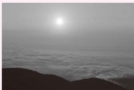
「スカイラインからの朝日と雲海」