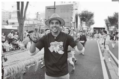
大きなわらじに大興奮の英BBCのクルー