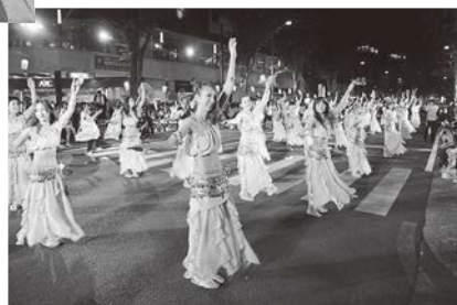
華やかなダンスソーダナイト