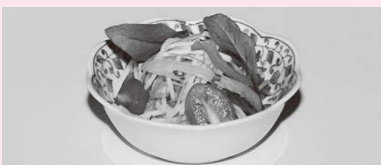
順光/被写体に直接当てる