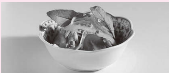
斜光/サイドから当てる反対側にレフ板を置く