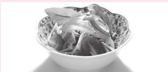
逆光/レフ板を被写体の手前に置く