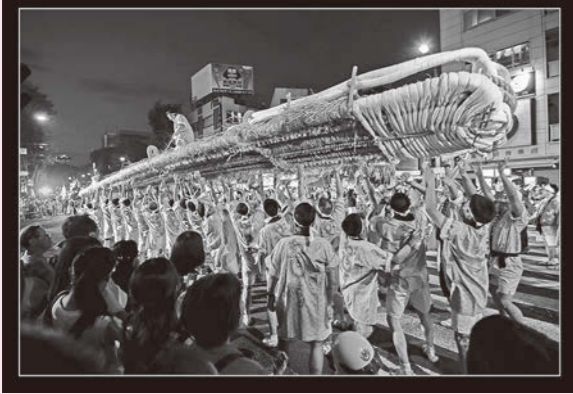
特選・「宙に浮く大わらじ」