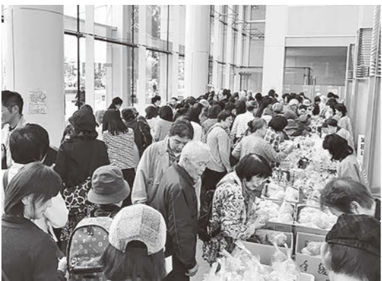
真剣に品定めをするお客さま