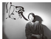
武田 双雲 たけだ・そううん

1975年熊本生まれ。東京理科大学を卒業後NTTに就職、約3年後に書道家として独立。NHK大河ドラマ「天地人」や世界遺産「平泉」、世界一のスノコ「京」など数々の題字を手がける。独自の世界観で全国で個展を開催。作品集「たのしか」『絆』など著書は40を超える。書道教室には約300人の門下生が通う(2005年新規集録締め切り)。2013年度、文化庁から文化交流使に任命され、ベトナム〜インドネシアにて活動するなど、世界各国からさまざまなオファーを受ける。公式ブログ「書力」: http://ameblo.jp/souun/ 公式サイト: http://www.souun.net/ 感謝69: http://kansha69.com/