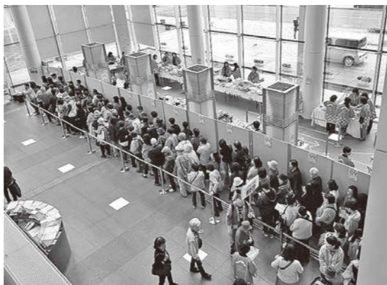
開店前から長蛇の列