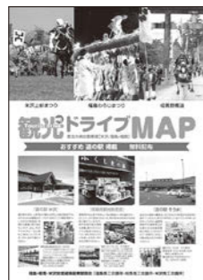
写真:昨年発行した沿線ドライブマップ