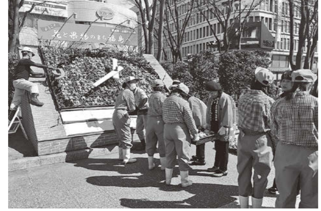
「スマイルくん」黄色、赤、薄紫のピオラ648株で彩りました

3月 26日(火)に3月全体会を開催し、22名が参加しました。 4月6日(土)に開催する「第15回花と街のふれあいプロジェクト」について話し合いました。 当日は、福島駅東口駅前広場に女性会ブースを設けて、会員がおもてなしの心で福島へお越しになる観光客をお出迎えます。