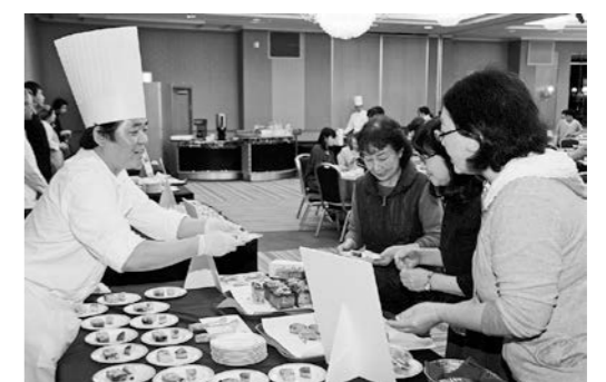
スイーツバイキングや会員交流ビアパーティーなど会員サービス事業を充実させます。 (写真: 30年度スイーツバイキング)