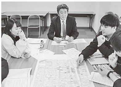
写真:大学生によるまちづくりワークショップ(2019年2月)