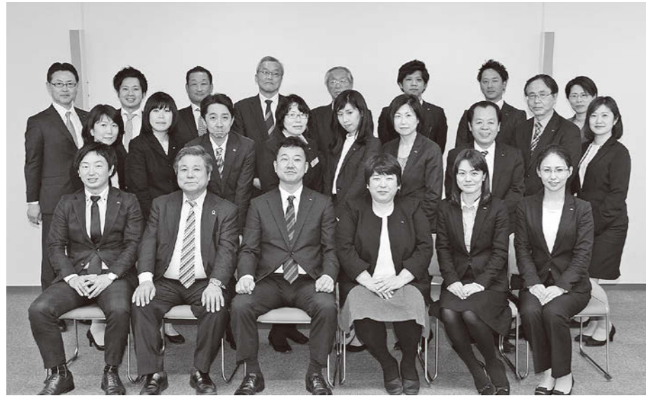
私たちがサポーターです

当所では、会員事業所の事業主・役員・従業員の皆様に確かな安心をお届けするため、共済制度を運営しています。経営者のさまざまな福利厚生のニーズに応えるため、保険引受会社であるアクサ生命保険(株)福島営業所の推進員がお客様の立場でご提案しております。