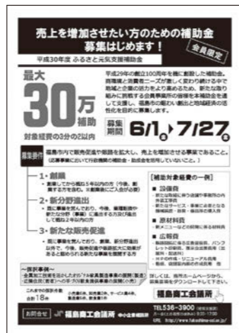
写真は昨年度のチラシです。