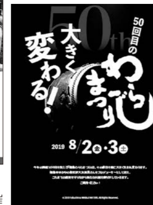
第50回福島わらじまつり 8月2～3日(金～土)開催