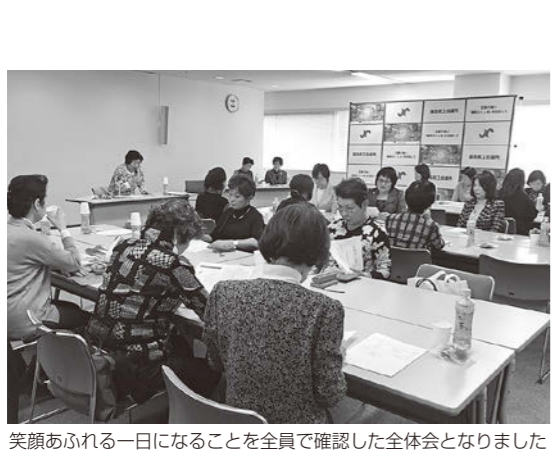
笑顔あふれる一日になることを全員で確認した全体会となりました

2019年3月31日(水)をもちましてセンターは相談業務を終了しました。有期実習訓練や実践型人材育成システム等に関するご相談は当面の間、福島労働局へお問合せいただきますようお願い申し上げます。