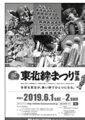
東北絆まつり2019福島 6月1～2日(土～日)開催

中核市福島市を中枢都市とする連携中枢都市圏構想の形成を見据えながら、東北中央自動車道を活用した広域連携や観光振興を推進し、交流人口の拡大を図ります。