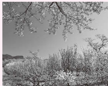
今月の表紙:「飯坂温泉 花ももの里」(飯坂町字館ノ山)

世界中から集めたハナモモ40品種約300本が5月初めごろまでの1ヵ月間、色鮮やかに咲き誇ります。