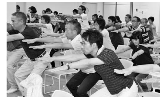
実践と理論をミックスした健康経営セミナーを開催します。 (写真: 30年度第1回健康経営セミナー)

また、25年ぶりに再編・統合した新部会の活動を活性化するほか、平成30年に実施した会員満足度調査で得られたニーズや課題に対応し、健康経営の推進をはじめ新たな会員サービスの実施など会員満足度の向上を図ります。