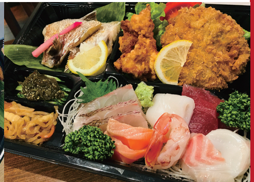
〈お家で晩酌セット〉