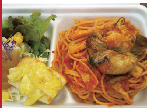
〈かきのトマトソースパスタ〉

自宅を改装してお店として10年余り。靴をぬいでゆったりとお食事を楽しんで下さい。濃厚なクリーム系やトマトソースパスタ、カキや海老、アサリなどを使ったシーフードメニューが大人気。コロナ収束後にぜひどうぞ。