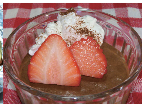
〈自家製チョコのムース〉