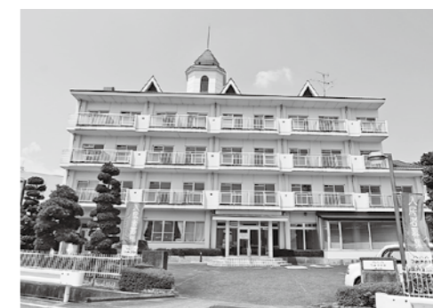
本社機能も兼ねる「つみきの家」

同社は、「つみきの家」以外にもコンサル事業などを運営しています。「困ったことがあれば、TSUMIKIに相談しよう」「お客様に『ありがとう』と言ってもらえる存在になろう」と掲げられた未来像に向かって歩んでいます。