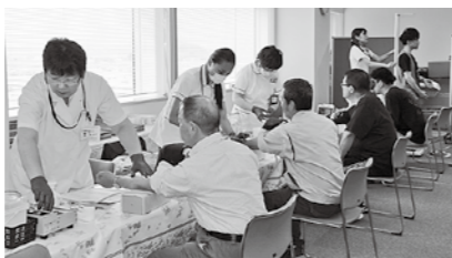
生活習慣病健診をはじめ会員サービスの向上に努めます

※詳しい内容は当所ホームページ「計画・報告」でご紹介しています。 http://www.fukushima-cci.or.jp