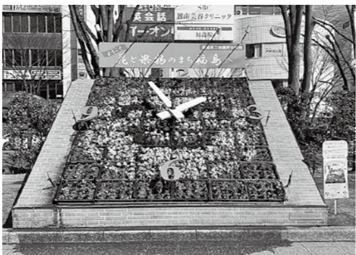
今回の図柄は「スマイル君」