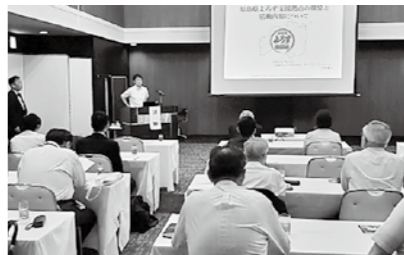
経営に役立つセミナーを展開します