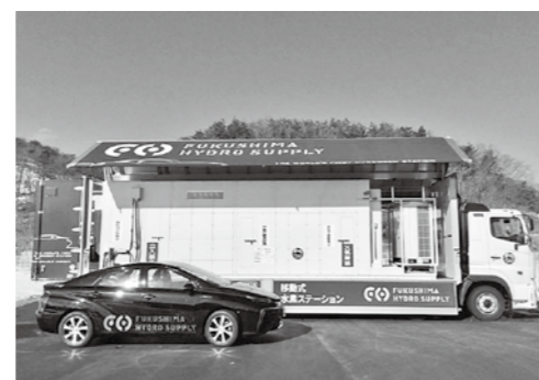
移動式水素ステーション

社員の育成にも熱心な同社では、2015年から社員研修プログラム「アポロ大学」を実施し、多岐にわたる研修が仕事へフィードバックされています。