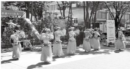
福島駅前元氣プロジェクトによるにぎわいイベント