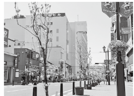
※画像は昨年の様子

春に可憐な花を咲かせる花ももが福島市の中心市街地をやさしく彩ります。 ことは、毎年春に設置している駅前通り、福島駅東口・西口広場の花ももブランター設置に加え、レンガ通り、県庁通りの一部に花ももの切り花を40鉢設置して、春の訪れを歓迎します。