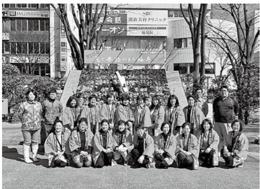
福島明成高校の先生、ありがとうございました

また、同日は会員交流委員会、地域・事業委員会が、令和元年度最後の会議を開催致しました。