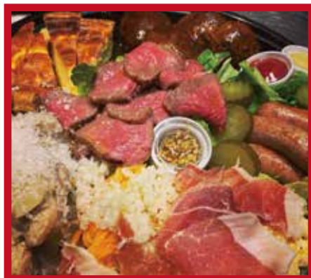
〈オードブル 3人前~、3,000円~〉