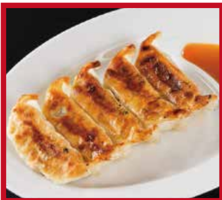
〈餃子セット 1~2人前・1,080円〉