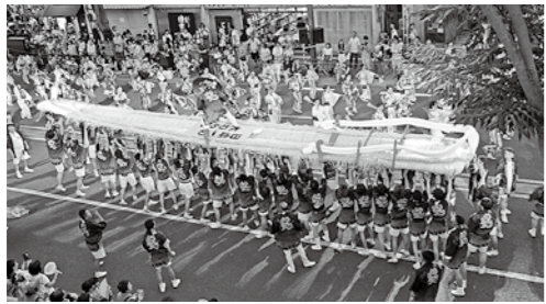
2年ぶりに勇壮な姿が期待される福島わらじまつり