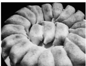
山女の円盤餃子。テイクアウトの利用が増加中

大きく減少する一方、テイクアウトの利用が増えています。特に土曜日はコロナ禍前の3倍、日曜日は4倍のテイクアウト利用があるそうです。常連客だけでなく、初めてのお客様がそのままピーターになるケースも増えています。