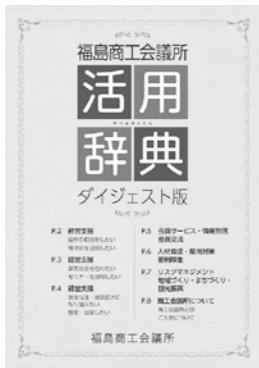
4月号に同封した活用辞典ダイジェスト版