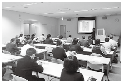
感染症予防に努めながら経営力向上に役立つセミナーを開催します