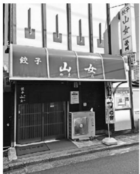
日曜休。営業時間はお尋ねください