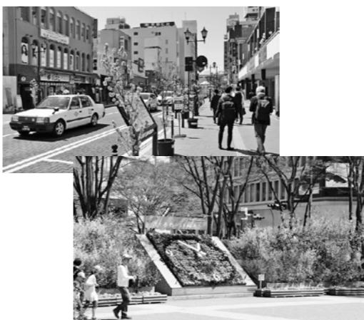
福島駅前通りに設置された花もも福島駅東口の花時計と花見山(画像はいずれも1昨年)

ましたが、市内には花見山だけでなく美しい花の鑑賞スポットがたくさんあります。サイトでは「ふくしま花回廊」として紹介しています。 https://www.hanamiyama.jp/