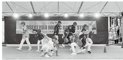
中心市街地から元気を発信するイベントを随時開催します(写真:アキフェスinえきまえ2020)