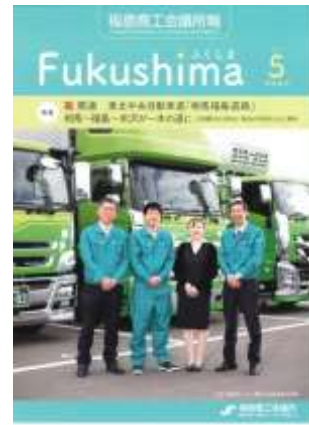
(写真)令和 3 年 5 月号

令和 2 年 5 月に創刊 800 号を数えた福島市の経済を伝える メディアです。令和 3 年 4 月号から表紙デザインが変わりました。