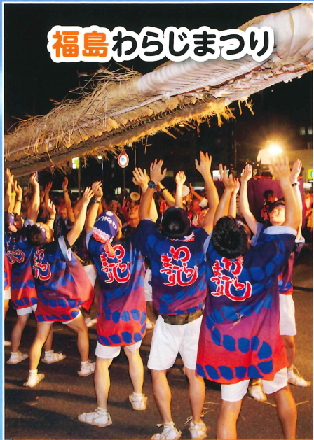
福島わらじまつり