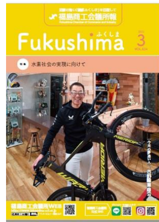
(写真)令和 5 年 3 月号

令和 2 年 5 月に創刊 800 号を数えた福島市の経済を伝えるメディアです。