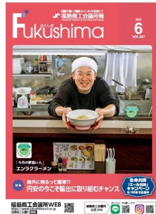
(写真)令和 5 年 6 月号

令和 2 年 5 月に創刊 800 号を数えた福島市の経済を伝えるメディアです。