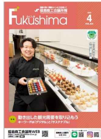
(写真)令和 5 年 4 月号

令和 2 年 5 月に創刊 800 号を数えた福島市の経済を伝えるメディア です。