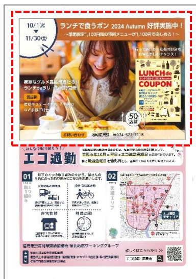
▲1/2 面広告枠(縦 129×横 175)