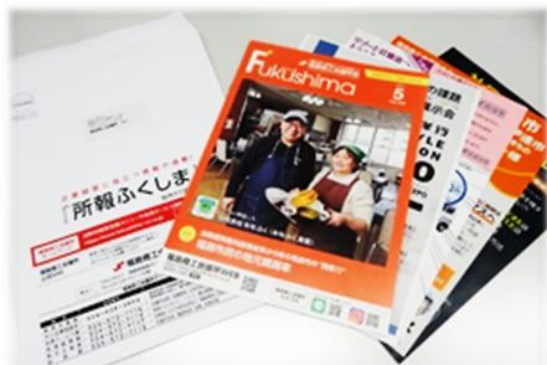
写真：チラシを同封して発送する際の状態

「所報ふくしま」に貴社がお持ちの商品チラシを同封して、会員事業所等へお届けします。