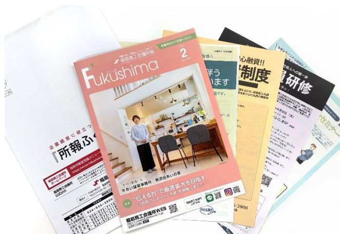
写真：チラシを同封して発送する際の状態

「所報ふくしま」に貴社がお持ちの商品チラシを同封して、会員事業所等へお届けします。