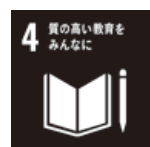
質の高い教育をみんなに