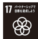
パートナーシップで 目標を達成しよう