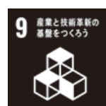
産業と技術革新の基盤をつくろう

県内外商工会議所工業部会との意見交換会や視察会等の交流を通して、それぞれが抱える課題を解決するための取組みや、先進的な事業の把握、販路拡大等の機会を創出する。