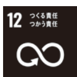
つくる責任 つかう責任

部会員の事業所や生産現場において、SDGsや脱炭素・カーボンニュートラルに取り組むための情報提供を行うとともに、部会員の事業所が行っている取組みの情報共有や、先進的な活動を行っている企業の視察会を開催する。