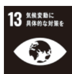
気候変動に 具体的な対策を