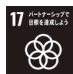
パートナーシップで目標を達成しよう