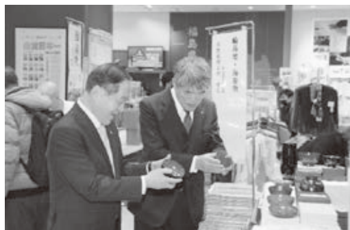
(物産展視察の様子)